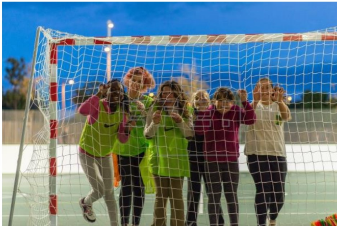
Las dos instituciones suman esfuerzos con el objetivo de que el deporte se un vehículo para transformar vidas de niños y jóvenes alrededor del mundo.