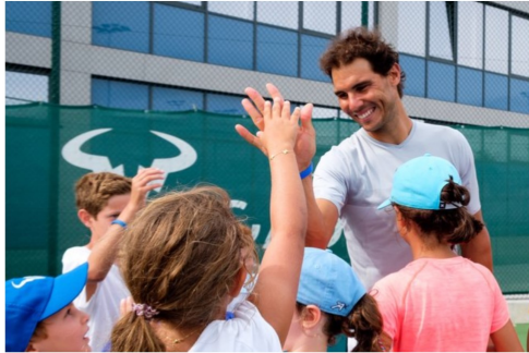
La Fundación Nadal trabajará con Laureus | sport