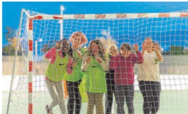
Algunos de los jóvenes beneficiarios del Proyecto llevado a cabo por la Fundación Rafa Nadal y Laureus Sport for Good

proyecto y aportando su amplia experiencia en el ámbito de la protección de la infancia y del uso del deporte como vehículo para transformar vidas de niños y jóvenes alrededor del mundo.