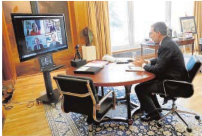
Don Felipe, ayer, durante la videoconferencia celebrada con los representantes de la Alianza de la Sanidad Privada Española

La Fundación Rafa Nadal y Laureus Sport for Good han firmado un acuerdo de colaboración con el fin de sumar fuerzas a beneficio de los niños y jóvenes vulnerables. Concretamente, la organización fundada por Nelson Mandela colaborará con el Centro Fundación Rafa Nadal de Palma, financiando parte del