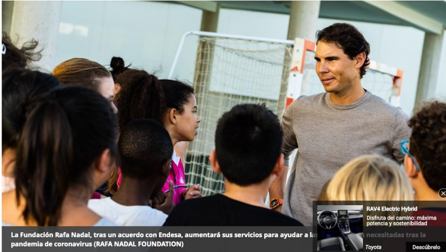
La Fundación Rafa Nadal, tras un acuerdo con Endesa, aumentará sus servicios para ayudar a la población vulnerable durante la pandemia de coronavirus