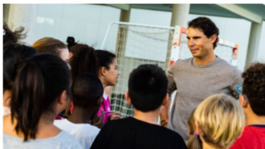
Fundación Rafa Nadal

En 2010 fue cuando empezó la actividad en la escuela que la Fundación tiene en Anantapur, India, así como el proyecto de tenis para jóvenes con discapacidad intelectual. Diez años después, la Fundación Rafa Nadal desarrolla su labor en 24 escuelas y centros. En todos ellos, el deporte se utiliza como herramienta de integración y desarrollo personal y social