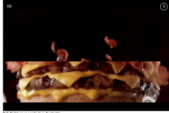
Rafa Nadal, en un evento de su Fundación.

La Fundación Rafa Nadal cumple una década de trayectoria . 10 años desde que empezó la actividad en sus primeros proyectos, en India y España. Desde entonces, la Fundación del 'tenista báscor' ha evolucionado hasta convertirse en un referente en el uso del deporte como vehículo para el desarrollo personal y social , llevando los valores y los aprendizajes inherentes a la práctica deportiva a entornos desfavorecidos y colectivos en riesgo de exclusión social .