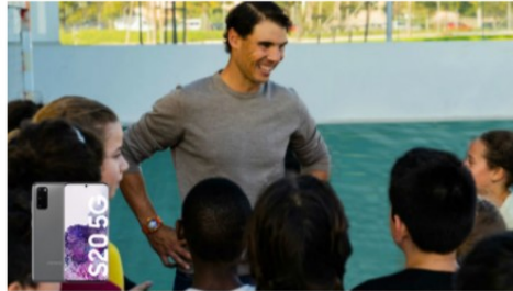
Rafa Nadal charla con varios niños

La Fundación Rafa Nadal cumple una década de trayectoria, 10 años desde que empezó la actividad en sus primeros proyectos, en India y España. Desde entonces, la Fundación del tenista balear ha evolucionado hasta convertirse en un referente en el uso del deporte como vehículo para el desarrollo personal y social, llevando los valores y los aprendizajes inherentes a la práctica deportiva a entornos desfavorecidos y colectivos en riesgo de exclusión social.